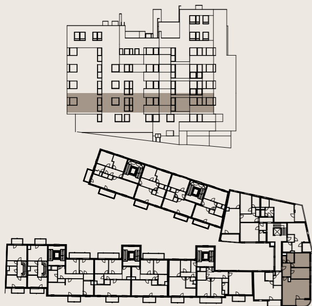
budova M1 - 2.NP / building M1 - 2nd floor