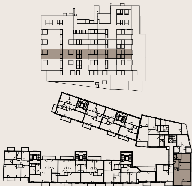
budova M1 - 3.NP / building M1 - 3rd floor