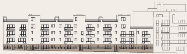
budova M2B - 1.NP / building M2B - groundfloor