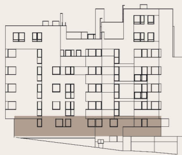
budova M1 - 1.NP / building M1 - 1st floor