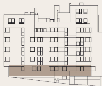
budova M1 - 1.NP / building M1 - 1st floor