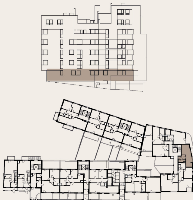
budova M1 - 1.NP / building M1 - 1st floor