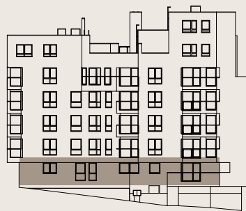
budova M1 - 1.NP / building M1 - 1st floor

Prodejní plocha bytu / apartment area total* 36,4 m 2