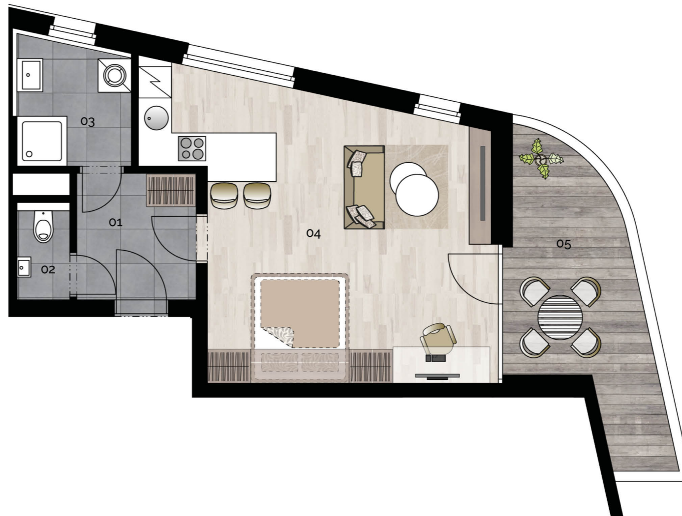
budova M1 - 1.NP / building M1 - 1st floor