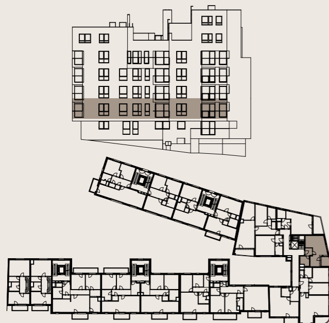
budova M1 - 2.NP / building M1 - 2nd floor