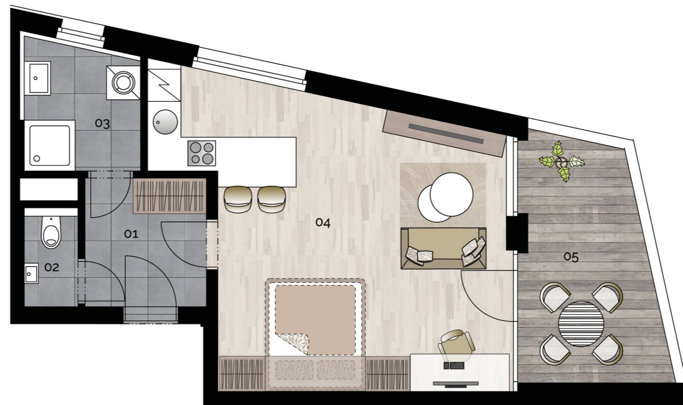
budova M1 - 2.NP / building M1 - 2nd floor