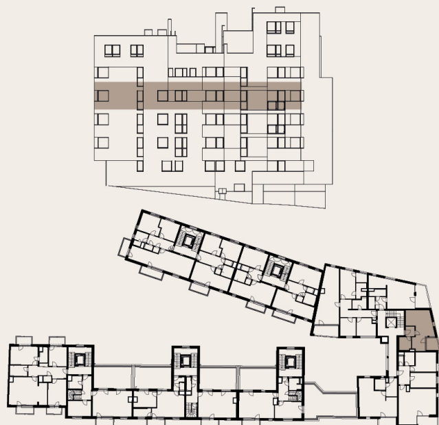
budova M1 - 4.NP / building M1 - 4th floor